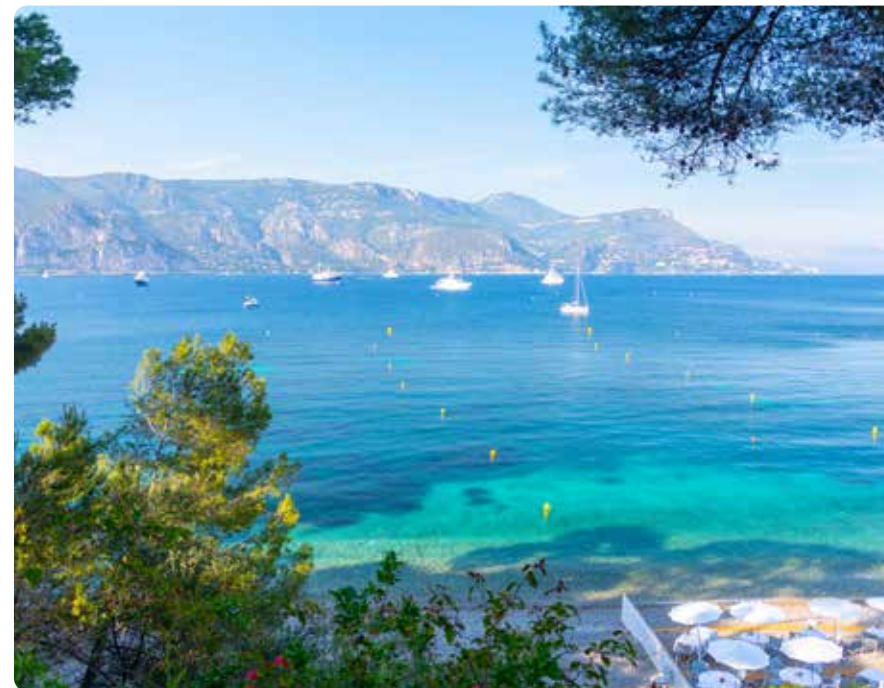
La côte du Var et ses nombreuses plages et criques

Avec plusieurs filières d'excellence dans les technologies marines et de la défense implantées dans la métropole de Toulon, le Var mise aussi sur les industries de demain pour renforcer son attractivité.