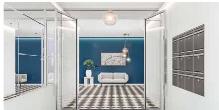
Exemple de hall sécurisé