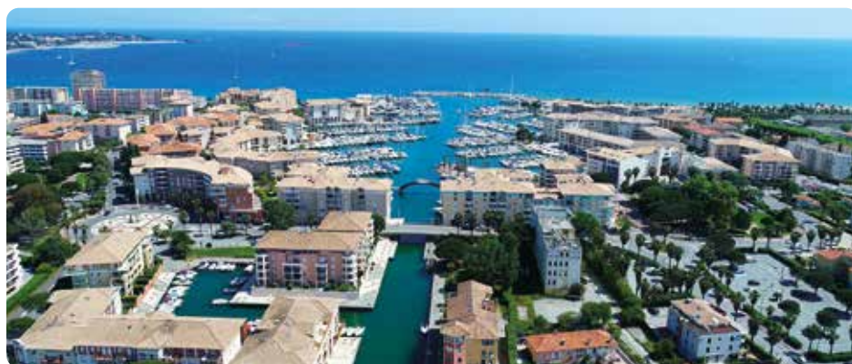
Le port de Fréjus

29 sites protégés aux Monuments historiques