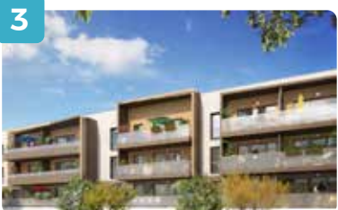
Vue bâtiment F