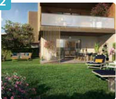
Vue jardin bâtiment A